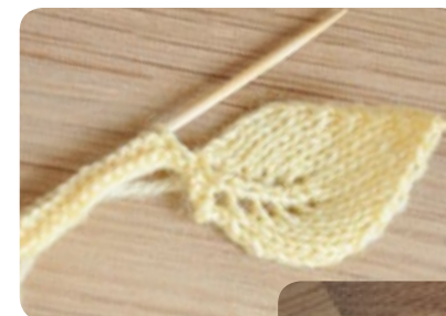
1 re pétale...