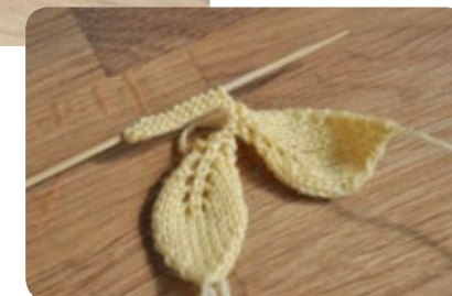
2 e pétale...